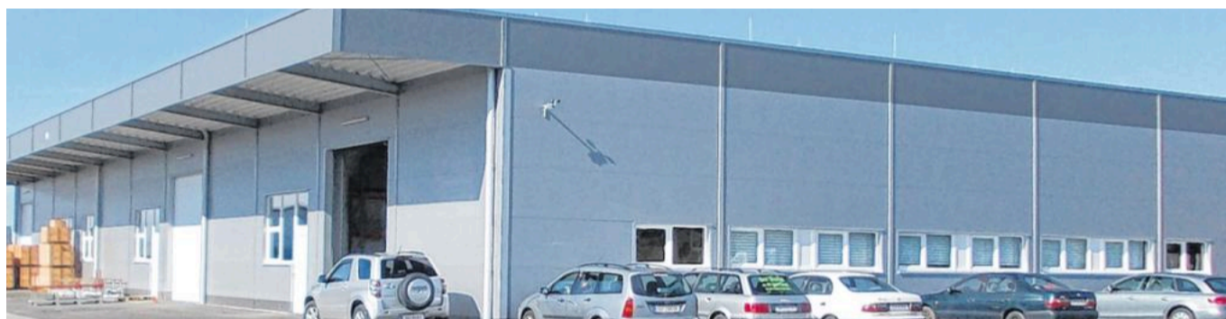
Höchstmöglicher technischer Standard und bestmögliche Qualität durch eine neue vollautomatische Produktion.