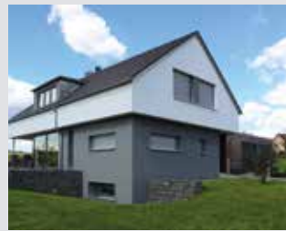
Vorbau und Unterputzkästen mit Rollläden oder Raffstore