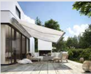
Markisen und Textiler Sonnenschutz