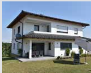
Ziegel-Rollladenkästen mit Sonnenschutz